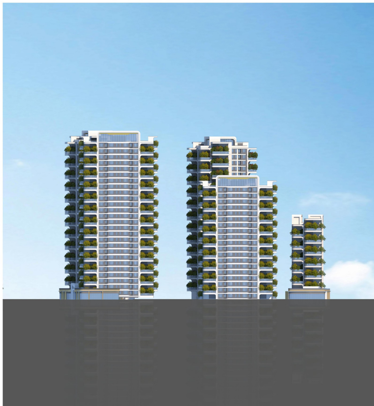
东侧整体彩色立面