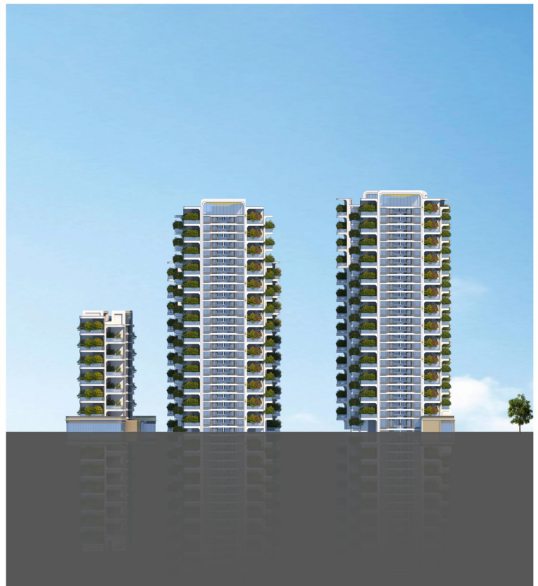
西侧整体彩色立面