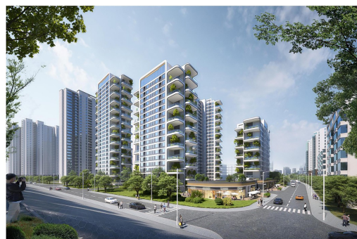
上港路与沿江路辅路路口人视图