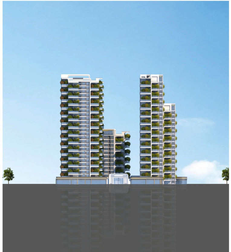
南侧整体彩色立面