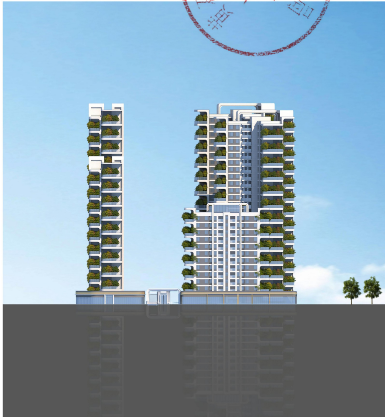
北侧整体彩色立面