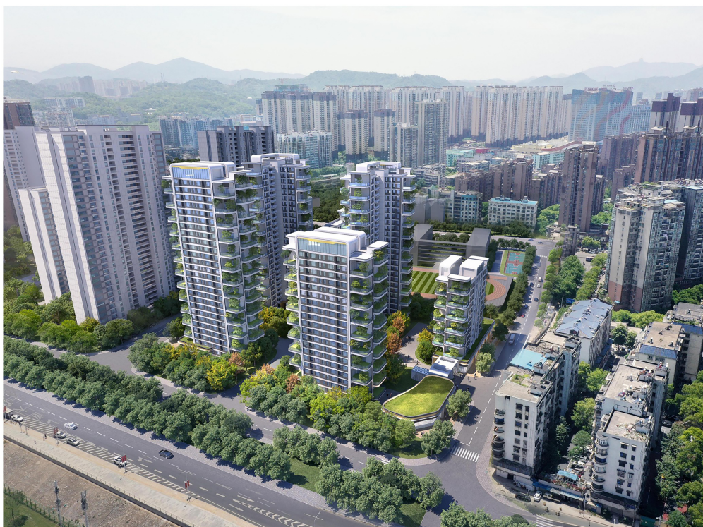
项目西侧拟建学校效果为意向效果，实际以后续审批为准。